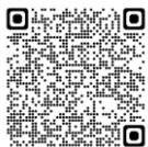
自宅療養中の方向けの情報