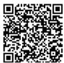
5類への移行について/県HP